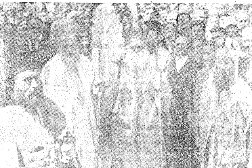
Εἰκόνες ἀπὸ τὴν ἐορτὴν τοῦ ἁγίου Ἰωάννου τοῦ Καλοκτένου Γ. Ο. Χ. Θηβῶν.

Ἐκκλησίας, ἡναγκάσθημεν καθ' ὑπαγῶρευσιν τῆς ὀρθοδόξου συνειδήσεως ἡμῶν δι' ἐγγράφου νὰ δηλώσωμεν εἰς τὴν Διοικουσαν τότε Ἱεραν Σύνοδον, ὅτι διακόπτομεν μετ' Αὐτῆς πᾶσαν ἐκκλησιαστικὴν ἐπικοινωνίαν, μὴ ἐπιθυμοῦντες νὰ μετᾶσχωμεν καὶ ἡμεῖς τῆς εὐθύνης διὰ τὴν ἀντικανονικὴν εἰσαγωγὴν τοῦ Γρηγοριανοῦ ἡμερολογίου ἐν τῇ Ἐκκλησίᾳ, ὡς καὶ διὰ τὸν ἀντεκκλησιαστικὸν καὶ μεσαιωνικὸν διωγμὸν ἐναντίον τῆς μερίδος τῶν Παλαιοεορτολογιτῶν. Εἰς τὸ σοβαρὸν τοῦτο διάβημα προέβημεν, κινούμενοι ὑπὸ τοῦ πόθου νὰ ἄρωμεν τὸ προξενηθὲν σκάνδαλον ὑπὸ τῆς ἑορτολογικῆς διαρρυθμίσεως, καὶ δισθρυπτόμενοι ὑπὸ τῆς ἐλπίδος, ὅτι ἡ Διοικοῦσα Σύνοδος συναισθανομένη τὴν, ἣν ὑπέχει εὐθύνην, ἀπέναντι τοῦ Θεοῦ διὰ τὴν διαίρεσιν τοῦ ὀρθοδόξου πληρώματος θὰ ἠδύδακε, ὡς ὄφειλε, νὰ θέσῃ ὑπὸ τὴν κρίσιν τῆς ὀλης Ἱεραρχίας τὴν σοβαρὰν διαμαρτυρίαν ἡμῶν, παρέχουσα ἀφορμὴν εἰς Αὐτὴν νὰ προβῇ εἰς τὴν ἀναθεώρησιν τῆς προηγουμένης σχετικῆς ἀποφάσεώς της. Δυστυχῶς ἡ Διοικοῦσα Σύνοδος τότε, ἀντι τούτου, ὅπερ ὄφειλε νὰ πράξει, ἐπιλαθομέ-