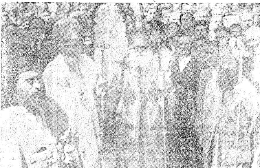
Εἰκόνες ἀπὸ τὴν ἐορτὴν τοῦ Ἁγίου Ἰωάννου τοῦ Καλοκτιμένου τοῦ Ο. Χ. Θηβῶν.

Ἐκκλησίας, ἡναγκάσθημεν καθ' ὑπαγῶρευσιν τῆς ὀρθοδόξου συνειδήσεως ἡμῶν δι' ἐγγράφου νὰ δηλώσωμεν εἰς τὴν Διοικουσαν τότε Ἱερὰν Σύνοδον, ὅτι διακόπτομεν μετ' Αὐτῆς πᾶσαν ἐκκλησιαστικὴν ἐπικοινωνίαν, μὴ ἐπιθυμοῦντες νὰ μετᾶσχωμεν καὶ ἡμεῖς τῆς εὐθύνης διὰ τὴν ἀντικανονικὴν εἰσαγωγὴν τοῦ Γρηγοριανοῦ ἡμερολογίου ἐν τῇ Ἐκκλησίᾳ, ὡς καὶ διὰ τὸν ἀντεκκλησιαστικὸν καὶ μεσαιωνικὸν διωγμὸν ἐναντίον τῆς μερίδος τῶν Παλαιοερτολογιτῶν. Εἰς τὸ σοβαρὸν τοῦτο διάβημα προέβημεν, κινούμενοι ὑπὸ τοῦ πόθου νὰ ἄρωμεν τὸ προξενηθὲν σκάνδαλον ὑπὸ τῆς ἑορτολογικῆς διαρρυθμίσεως, καὶ δισθρυπτόμενοι ὑπὸ τῆς ἐλπίδος, ὅτι ἡ Διοικοῦσα Σύνοδος συναίσθανομένη τὴν, ἣν ὑπέχει εὐθύνην, ἀπέναντι τοῦ Θεοῦ διὰ τὴν διαίρεσιν τοῦ ὀρθοδόξου πλῆρωματος θὰ ἠδύοκει, ὡς ὄφειλε, νὰ θέσῃ ὑπὸ τὴν κρίσιν τῆς ὀρθῆς Ἱεραρχίας τὴν σοβαρὰν διαμαρτυρίαν ἡμῶν, παρέχουσα ἀφορμὴν εἰς Αὐτὴν νὰ προβῇ εἰς τὴν ἀναθεώρησιν τῆς προηγουμένης σχετικῆς ἀποφάσεώς της. Δυστυχῶς ἡ Διοικοῦσα Σύνοδος τότε, ἀντι τοῦτου, ὅπερ ὄφειλε νὰ πράξῃ ἐπιλαθομέ-